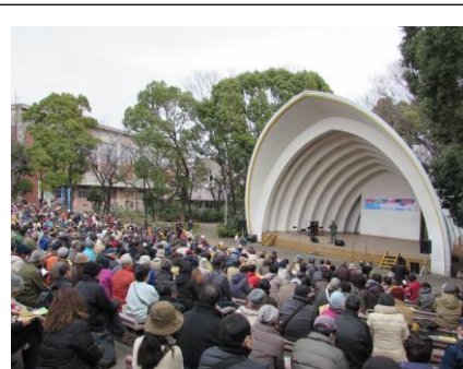
午後1時から中央舞台での講演とスピーチに老若男女、大勢が聞き入った。

福島第一原発事故から5年という節目の年に開かれた原発ゼロ集会は、そうした状況の中で、川崎市民の中に、原発はいらないという想い、福島原発事故の被害者と連帯して闘いたいという想いが強くあることを示し、政府や電力会社など原発推進勢力への抗議のメッセージを発信する場となった。また、時間の経過や記憶の風化とともに