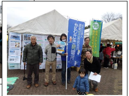
「パネル展示」と「やきとり」販売で出展。

その後、集会アピールを採択。原発再稼働反対、子どもを放射能から守ろうと訴え、武蔵小杉駅まで大規模なデモ行進がおこなわれた。