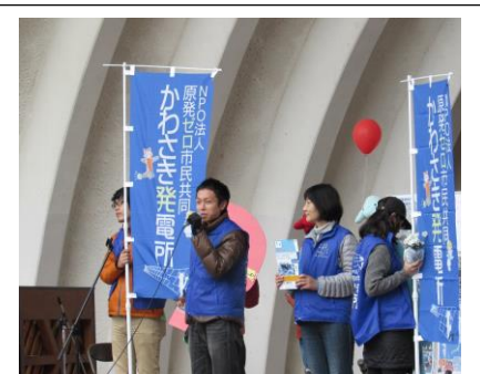
私たちが団体の活動紹介。3号機の屋根を貸してくださいとアピールした。

運動参加者が全国的に減少傾向にある中で、様々な困難を乗り越えて思想・信条・支持政党の違いを超えて市民が共闘する実行委員会を維持してきた川崎市で、昨年より300人も参加者を増やして集会を成功させたことは、原発立地地域で闘っている市民や福島県民を大きく励ますことにつながるだろう。