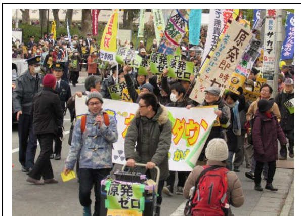
午後2時すぎ中原平和公園を出発して武蔵小杉駅までデモ行進。「子どもの未来のために原発なくそう」

3月13日(日)、中原平和公園で「第五回原発ゼロへのカウントダウン in かわさき」集会&デモが開催され1200名の市民が参加した。